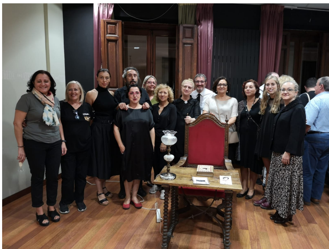
1ª Velada Necrológica en el ATENEO, 11 octubre 2019.